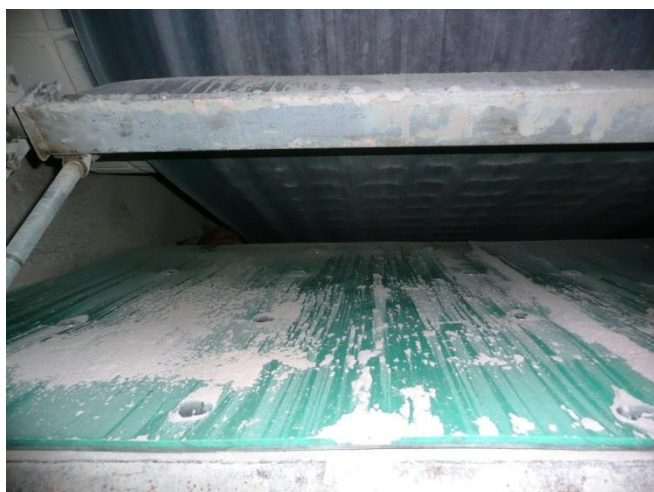
Skluz po osazení Remaslide deskou tl. 8mm